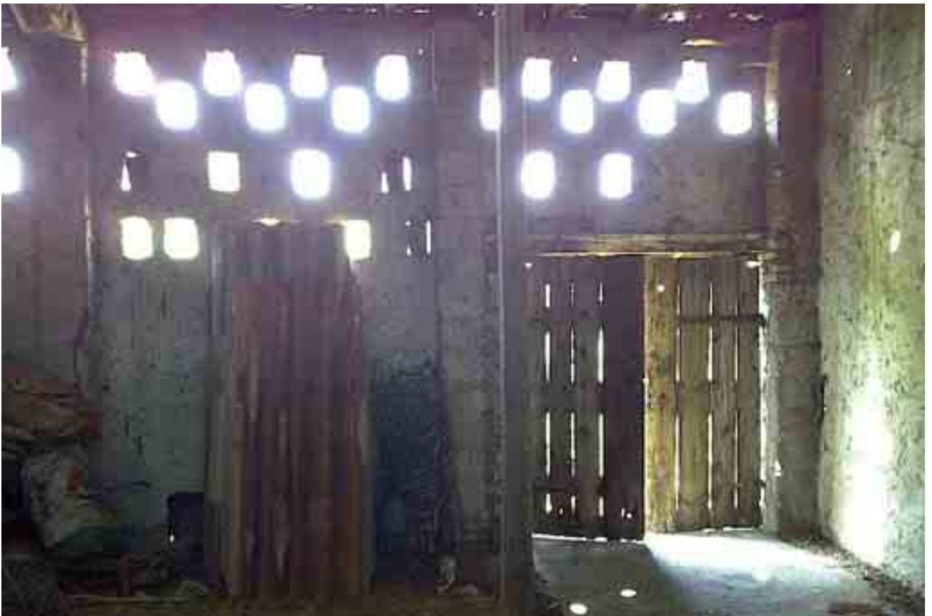
16_ dettaglio ingresso piano primo stanza 2