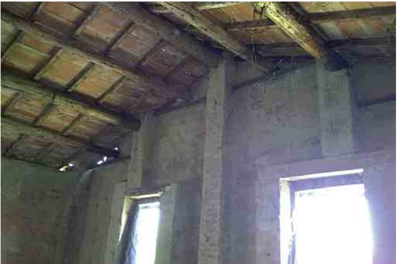
13_ dettaglio copertura piano primo stanza 1