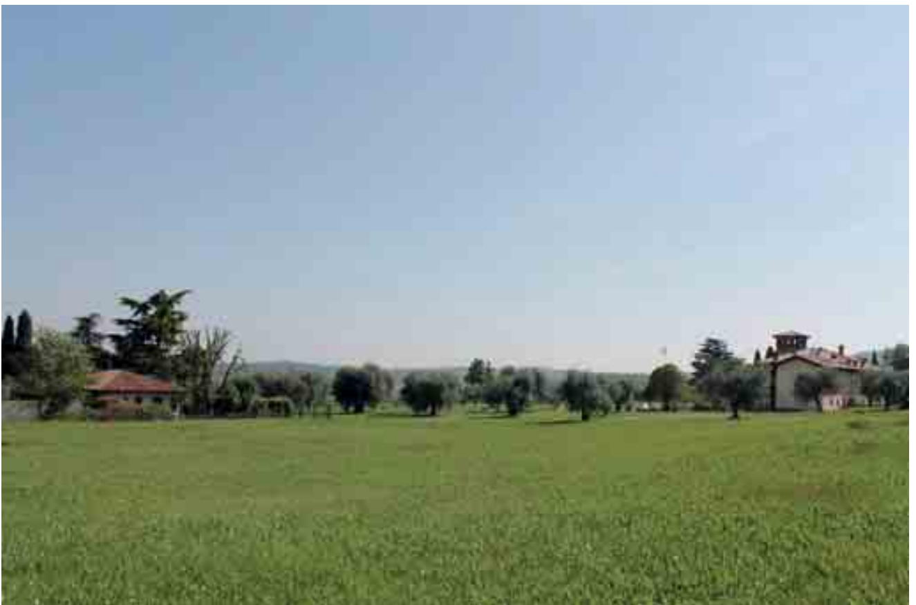
28_ vista da lotto di progetto