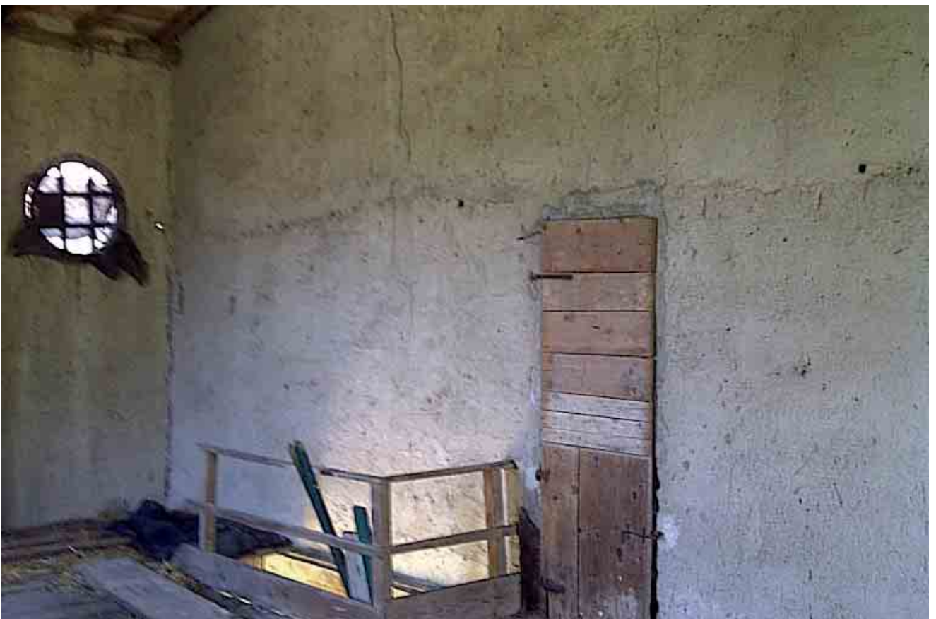
14_ dettaglio interno piano primo stanza 1