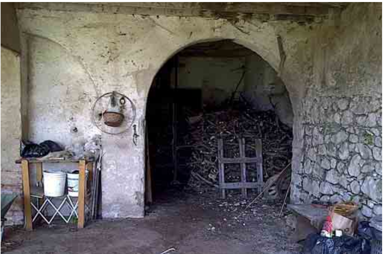
10_ dettaglio archi piano terra