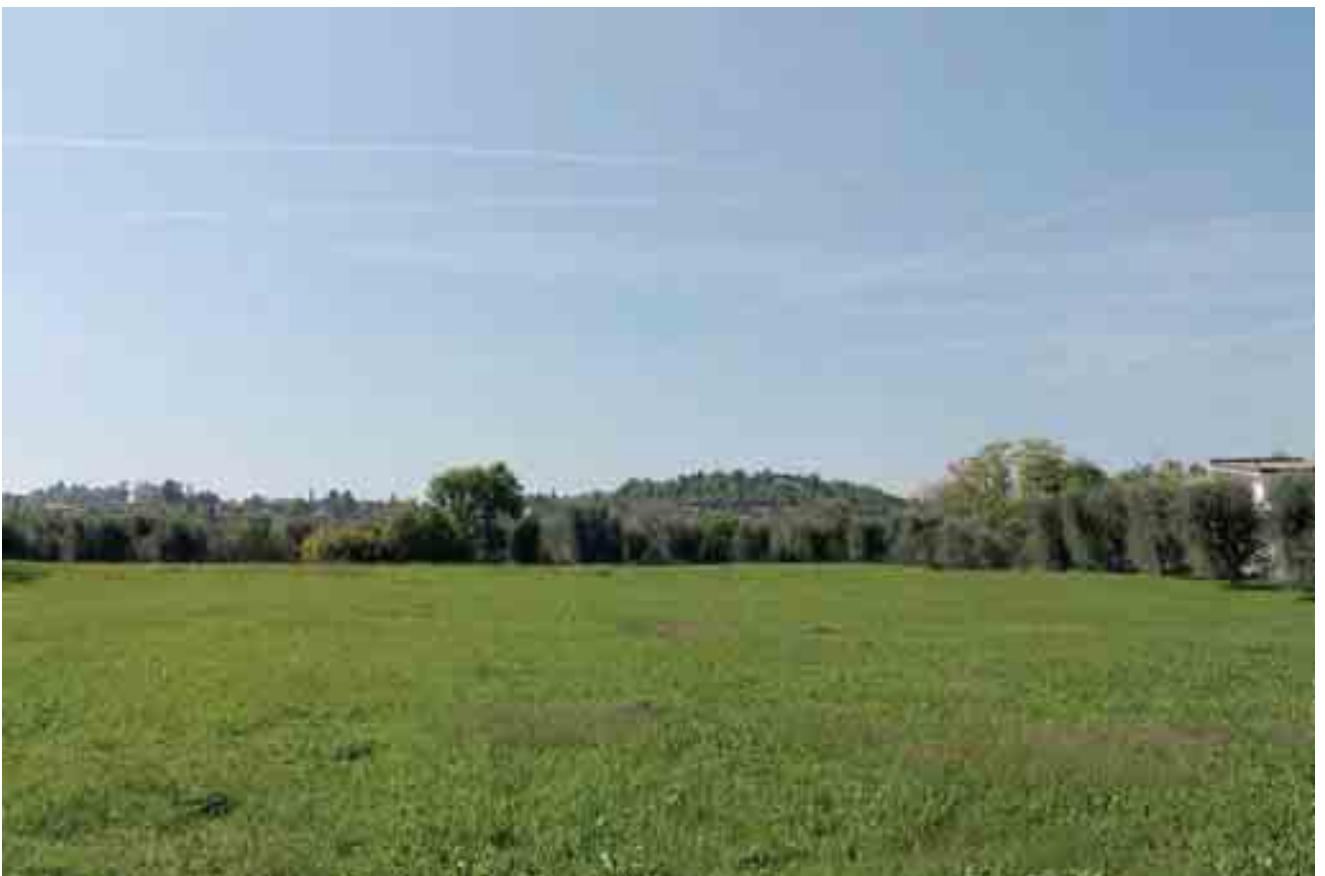
26_ vista lotto di progetto da sud