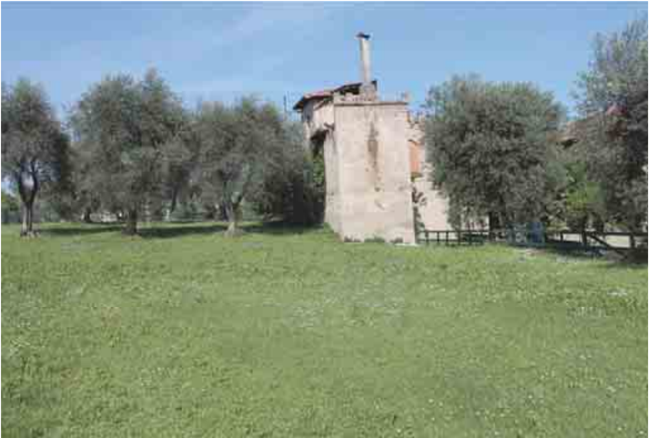
07_ prospetto sud-ovest