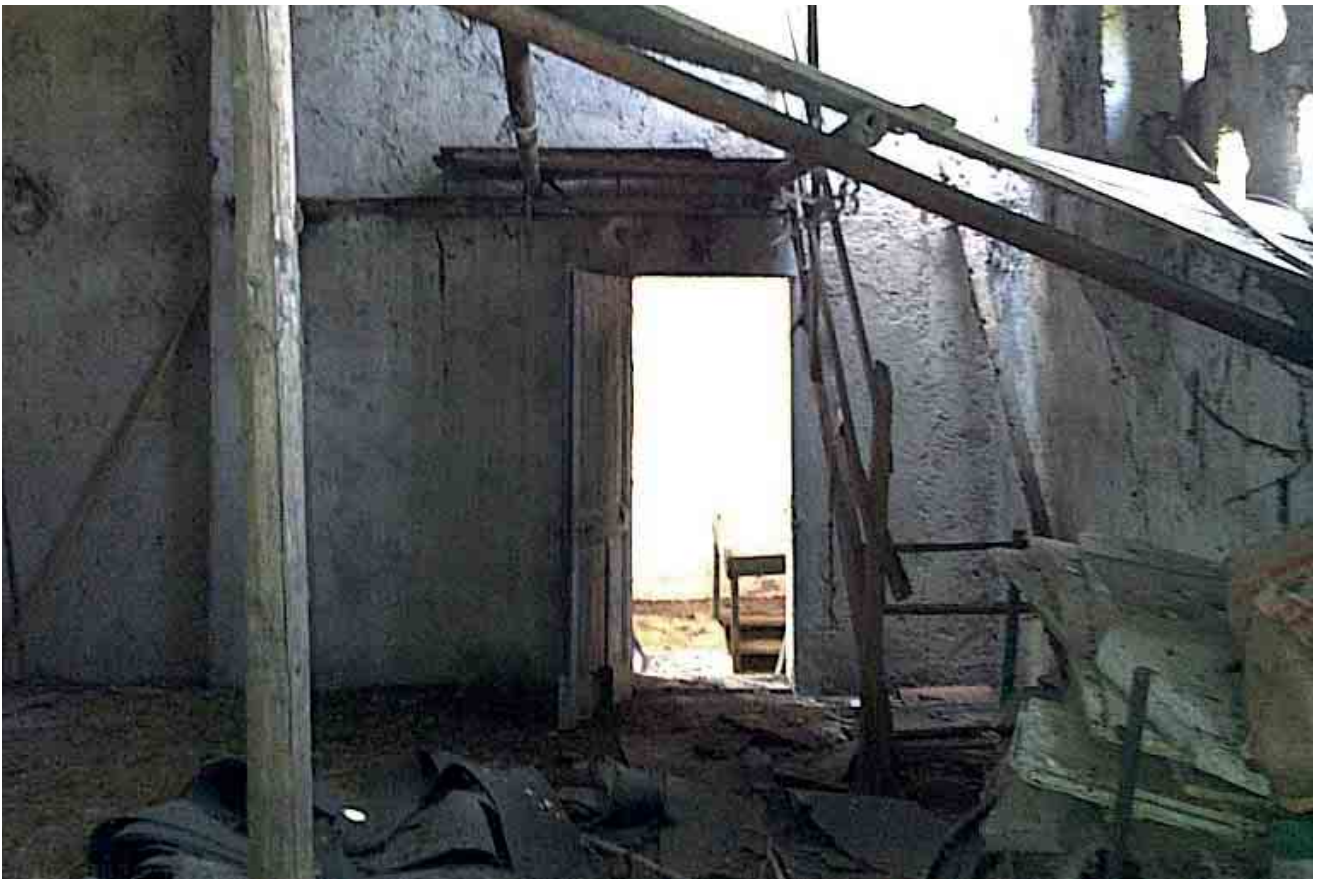
17_ dettaglio passaggio interno stanza 2- torretta