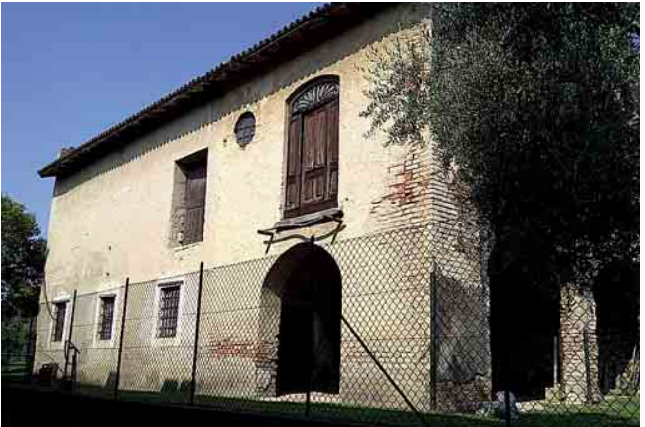
02_ prospetto sud-est