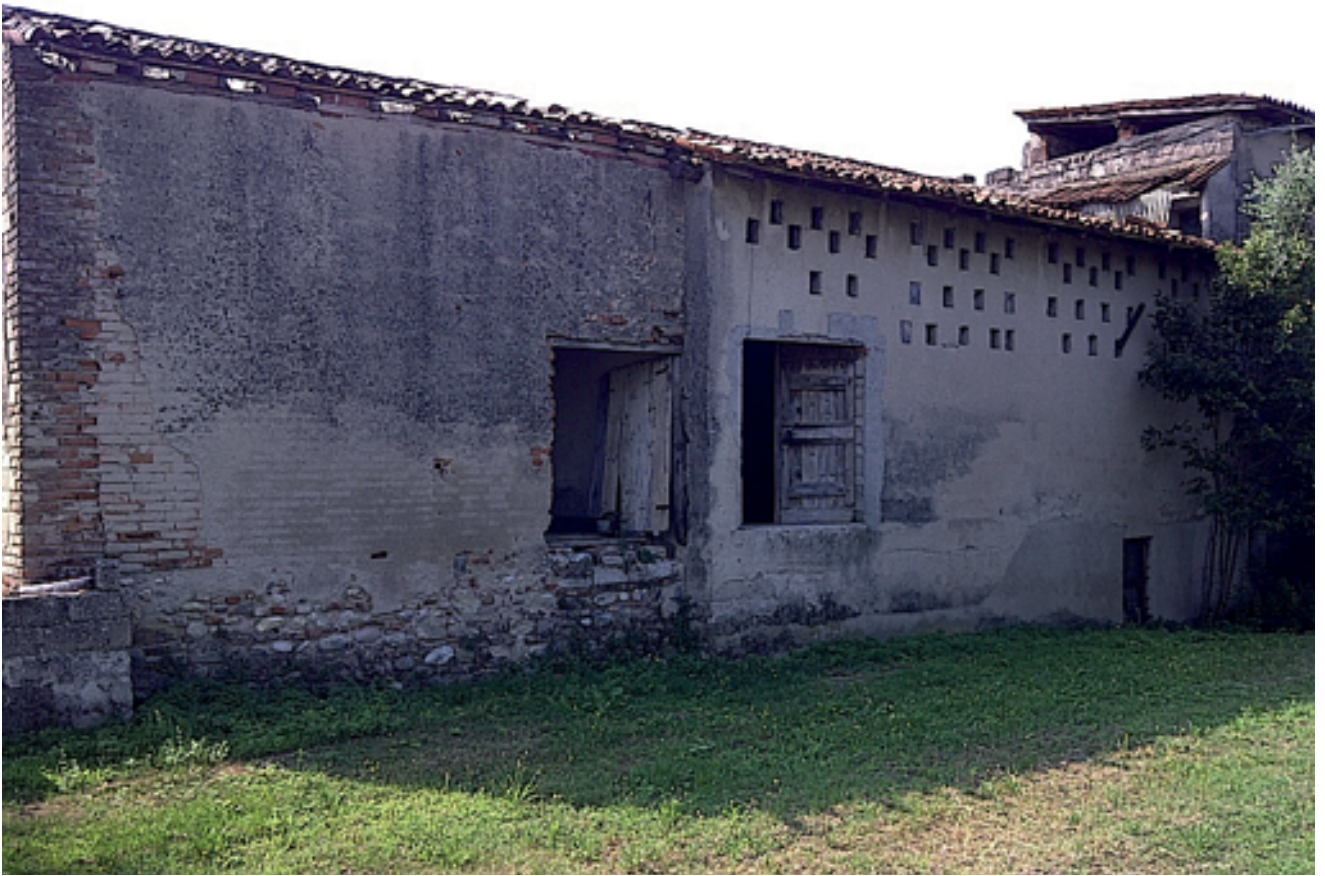
05_ prospetto nord-ovest