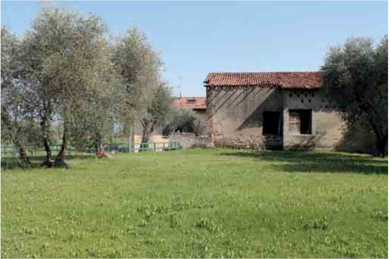
06_ prospetto nord-ovest