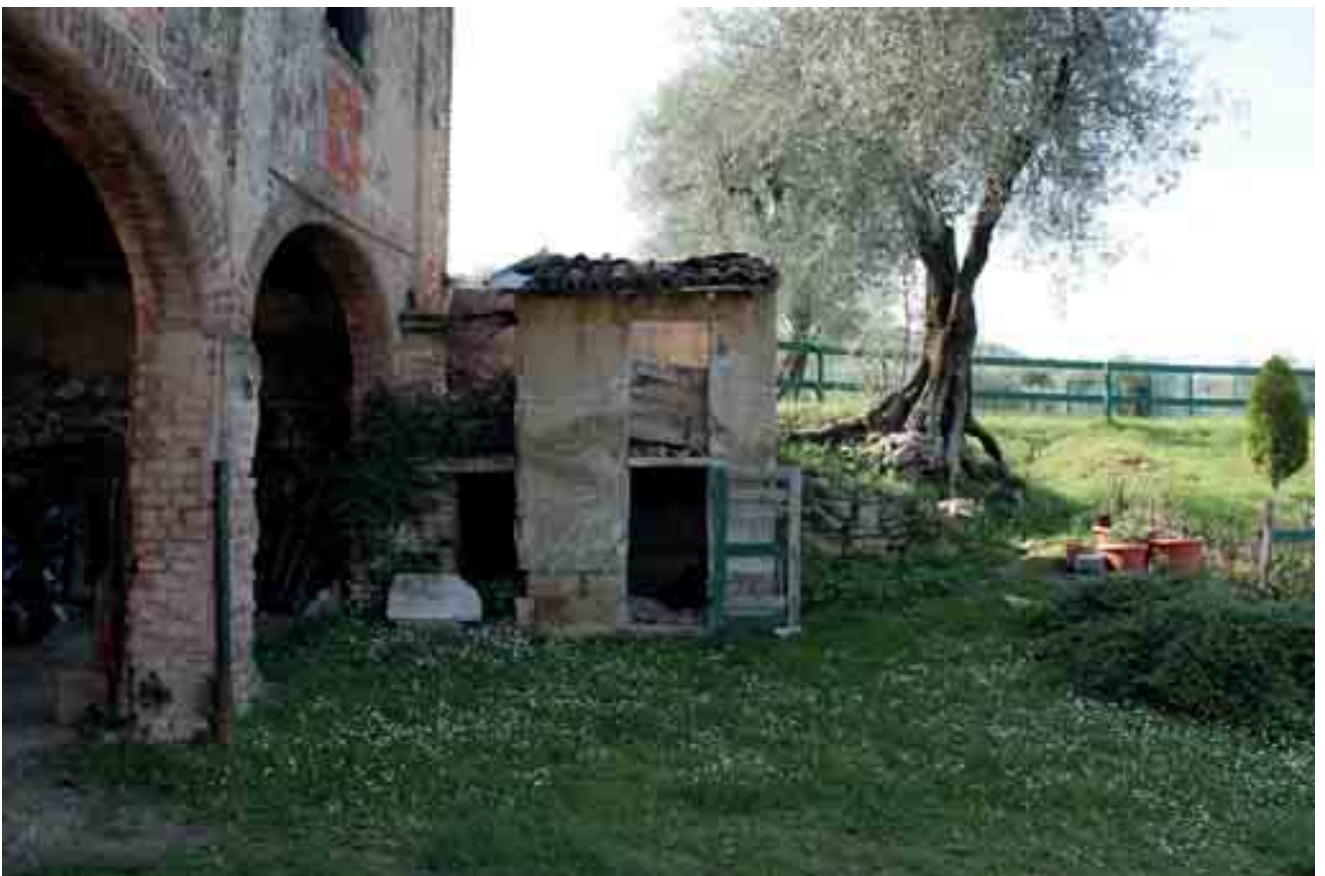
08_ dettaglio prospetto sud-est