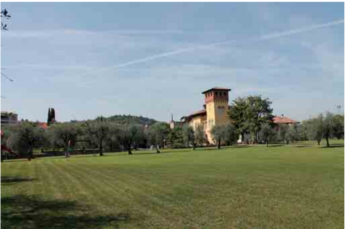
20_ prospetto sud villa