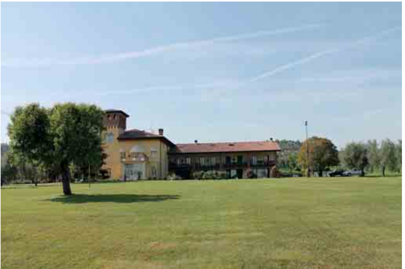
19_ prospetto sud-est villa