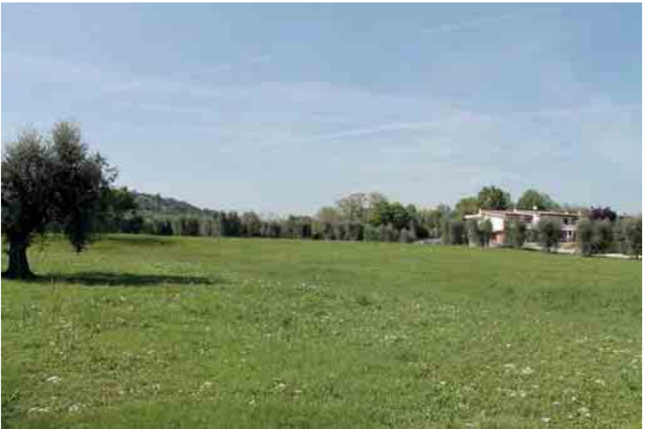
23_ vista lotto di progetto da sud-ovest