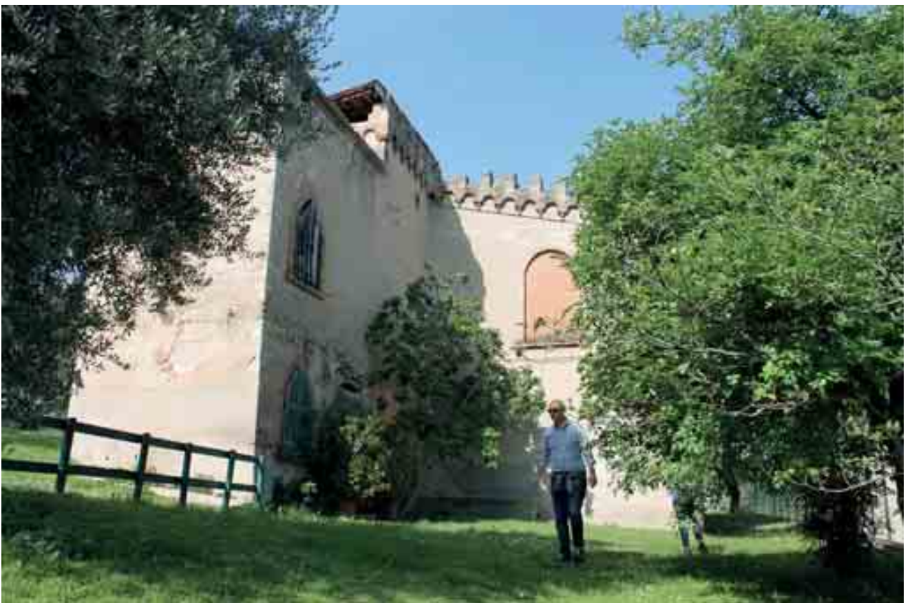
22_ area piscina