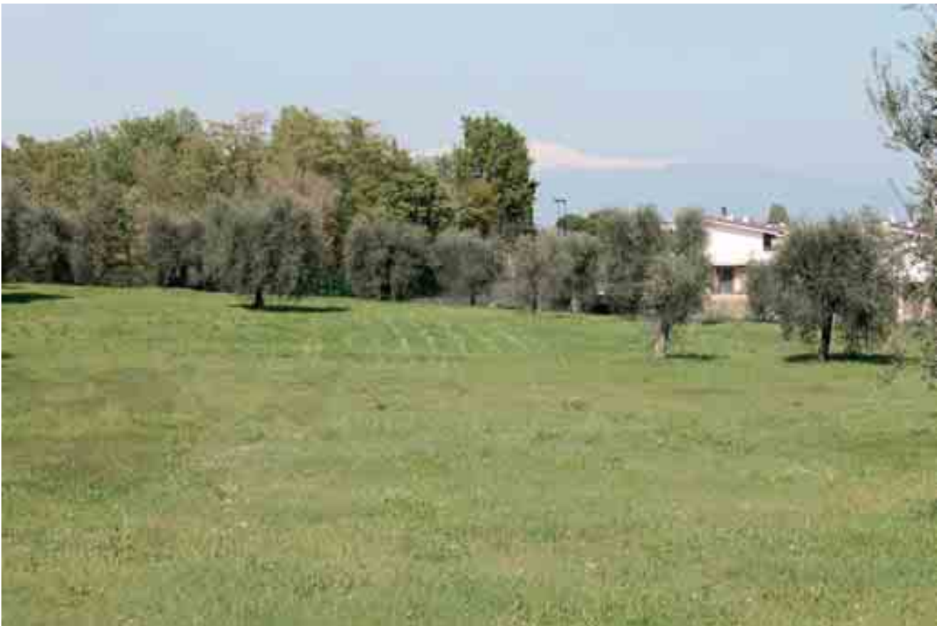
27_ vista lotto di progetto da nord-ovest