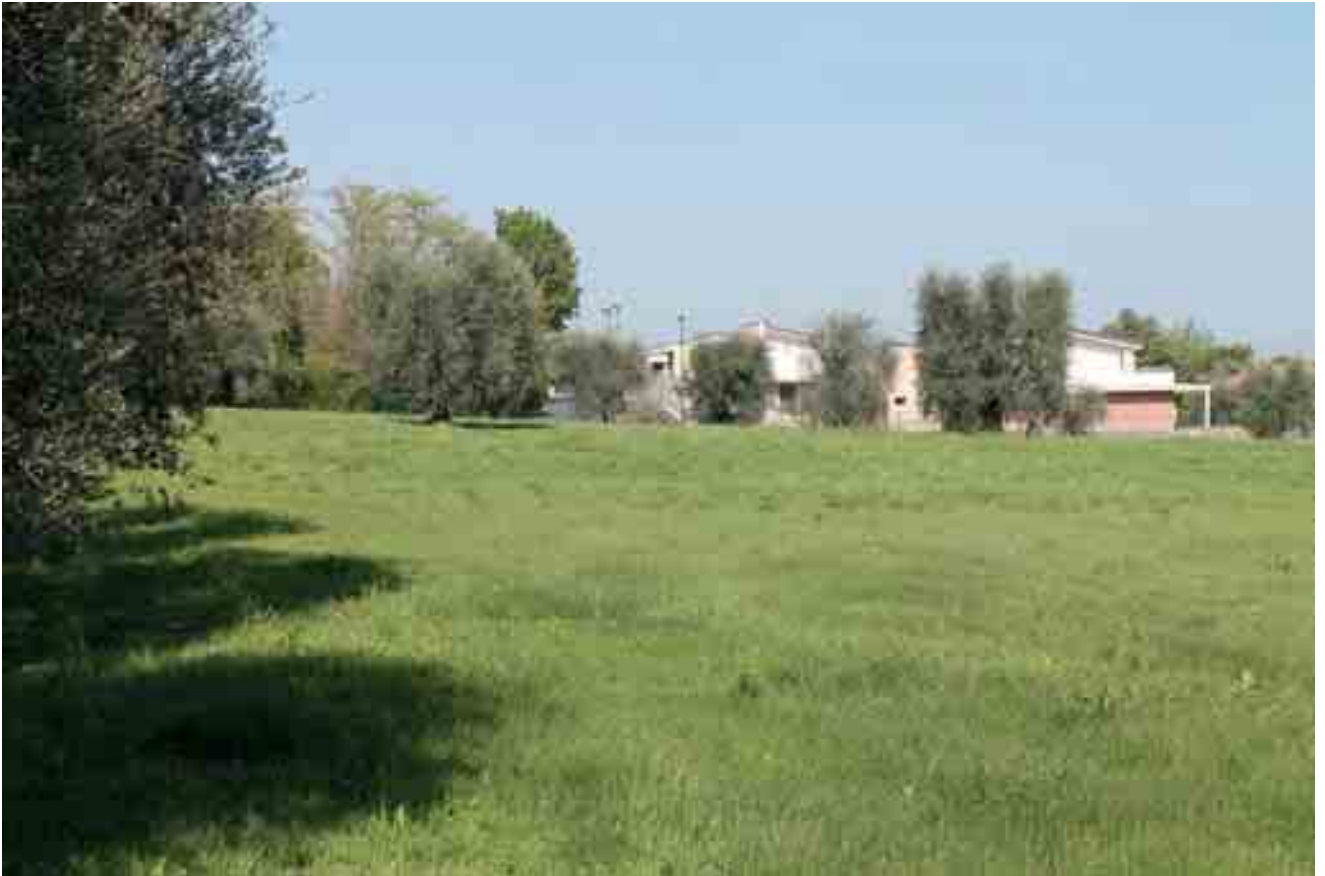
25_ vista lotto di progetto da ovest