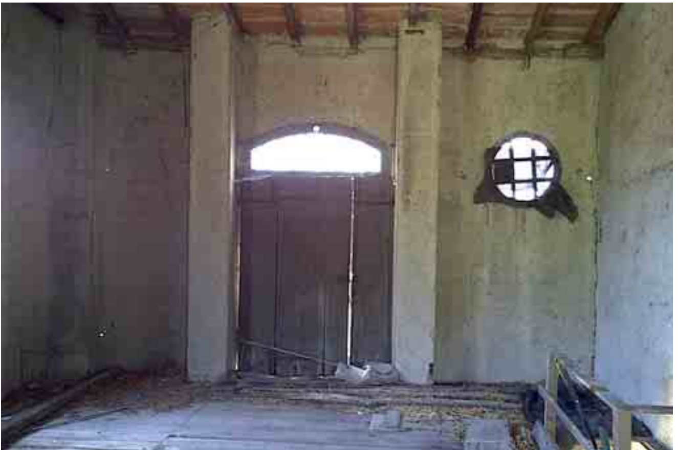
11_ dettaglio interno piano primo stanza 1