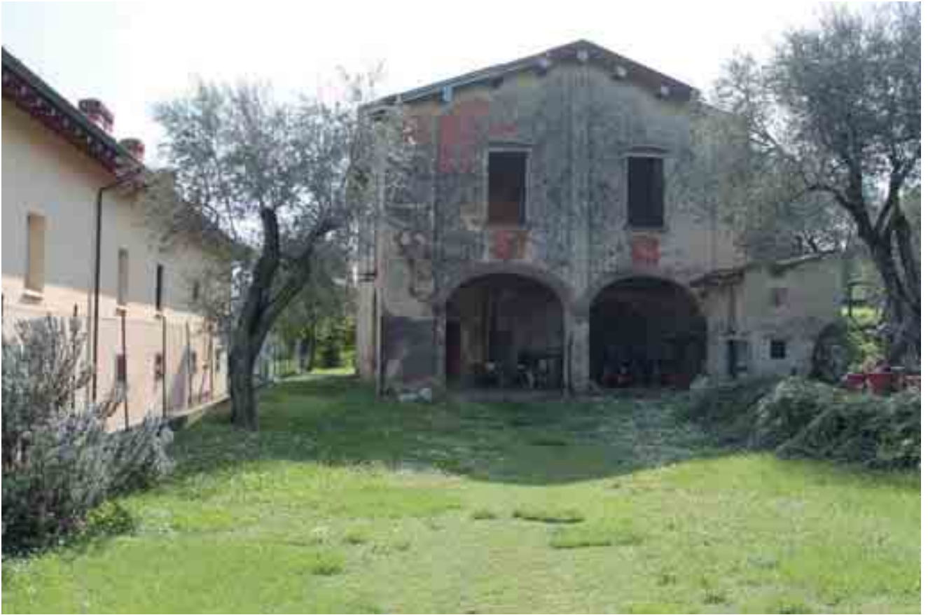
01_ prospetto nord-est