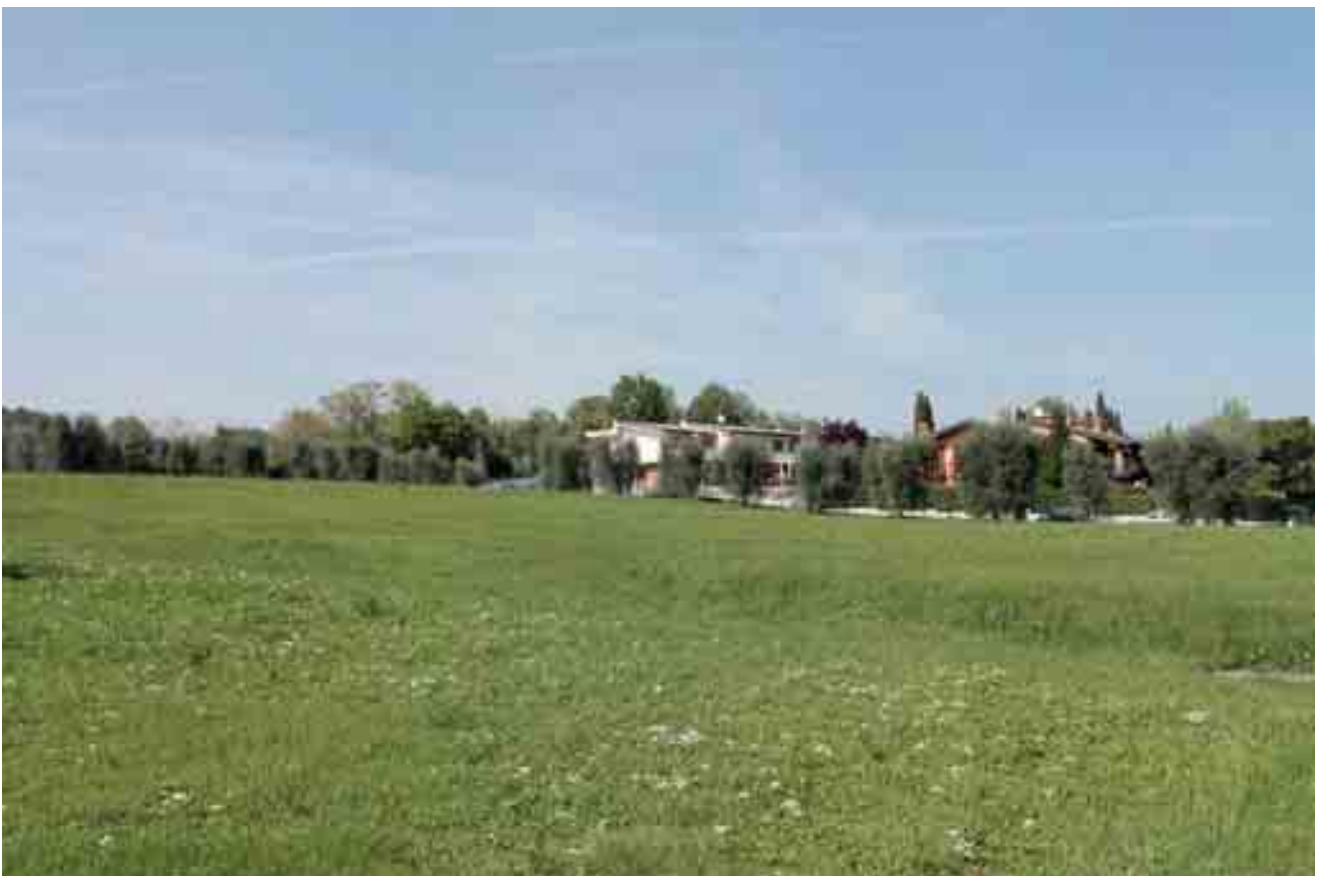
24_ vista lotto di progetto da sud-ovest