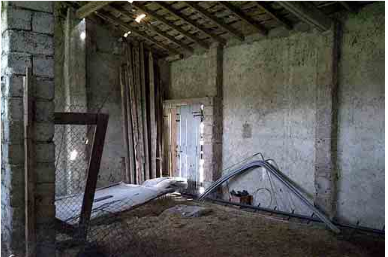
15_ dettaglio interno piano primo stanza 2