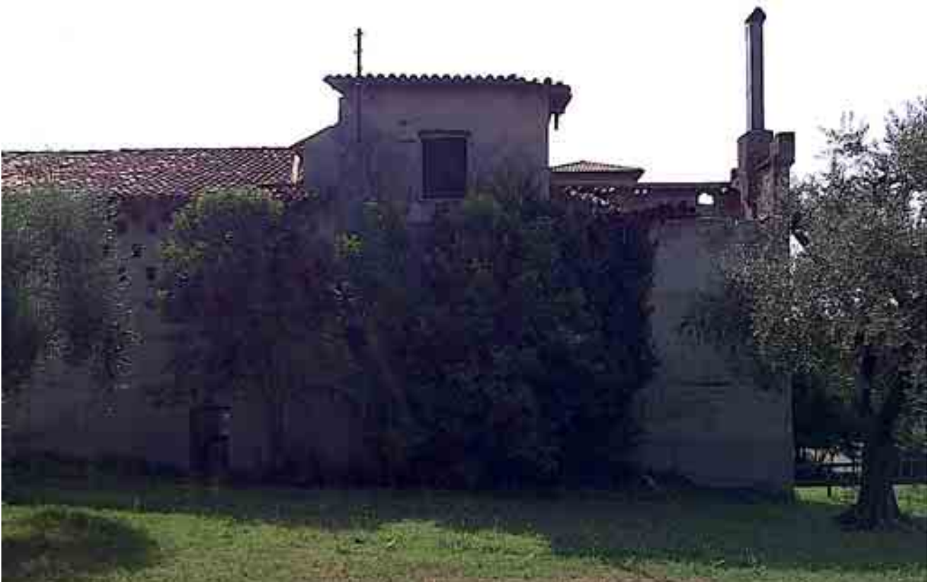
04_ prospetto nord-ovest