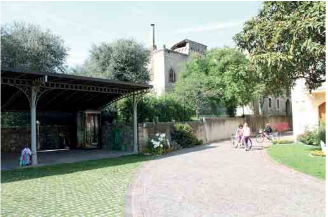
21_ tettoia per autorimessa e cascina sullo sfondo