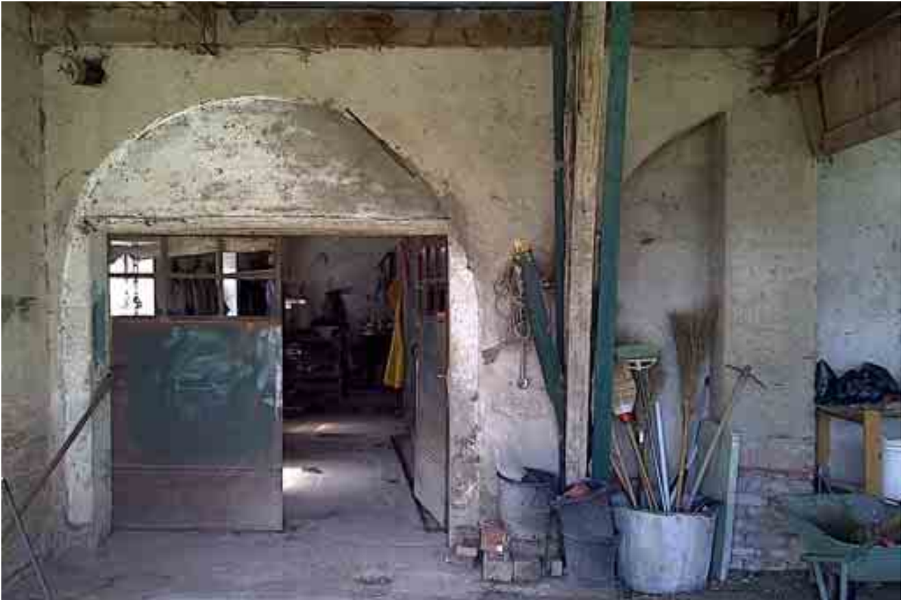
09_ ingresso nord-est piano terra