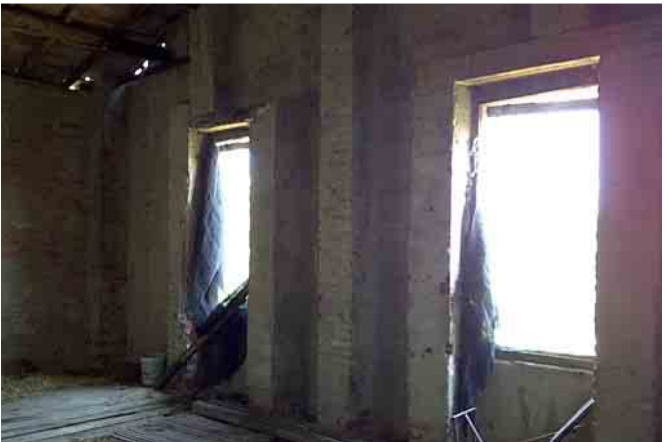
12_ dettaglio finestre piano primo stanza 1