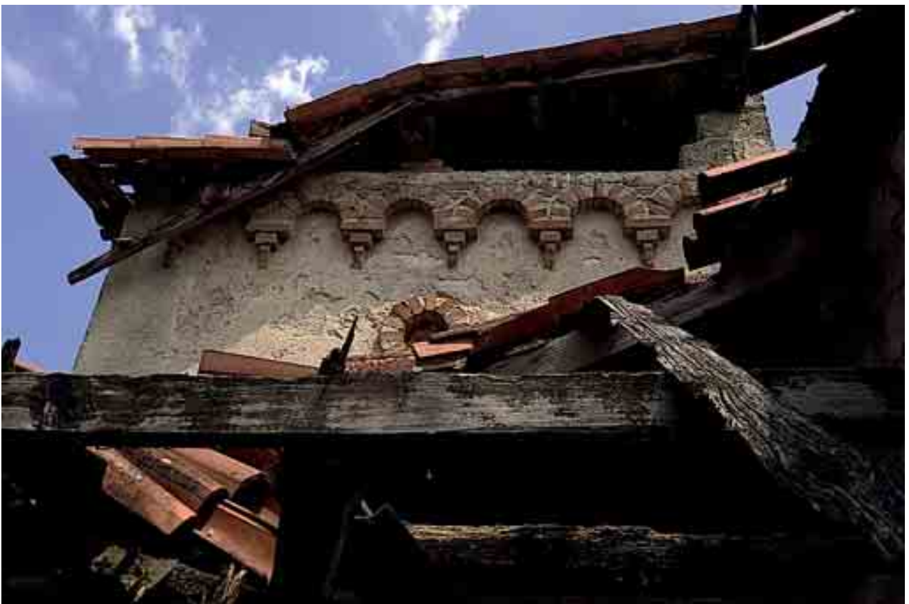
18_ dettaglio torretta