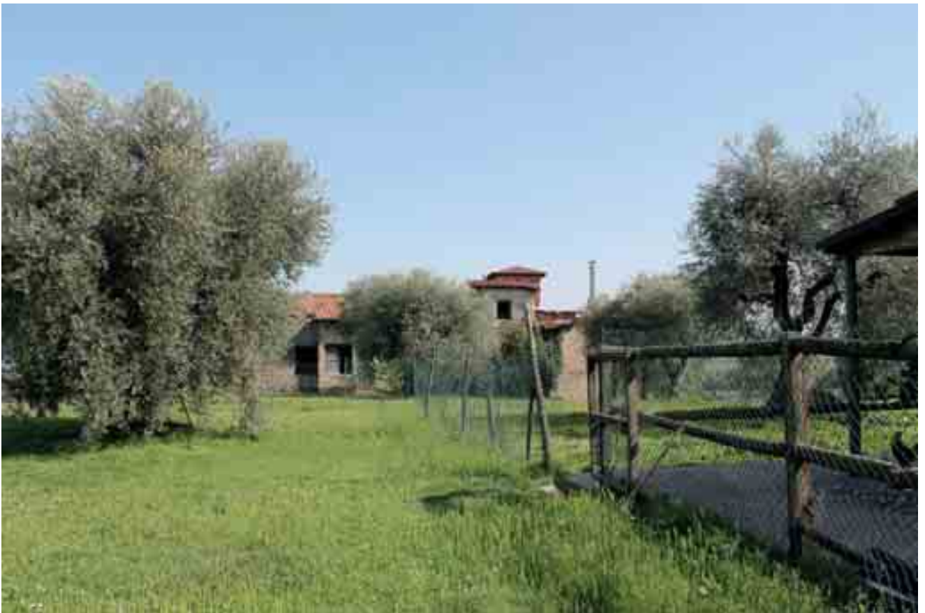
03_ prospetto nord-ovest